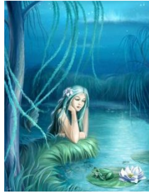
2. Мифическая женщина, живущая в воде