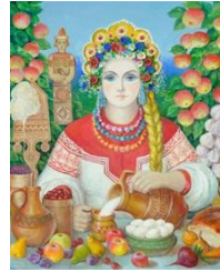
4. Богиня плодородия