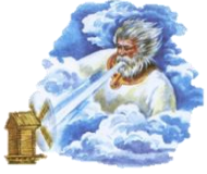
5. Бог ветра