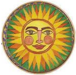
1. Бог солнца