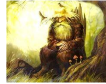
7. Лесной дух