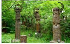
6. Деревянная статуя языческого божества