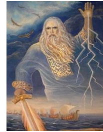
3. Бог грома